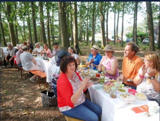
1. Dorfpicknick 2020

2021: Windecker Heimatgeschichten Band 2