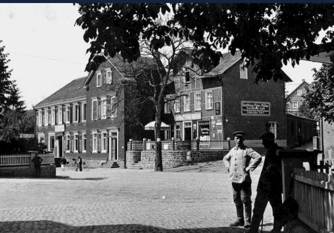
Bahnhofsvorplatz in Schladers um 1930