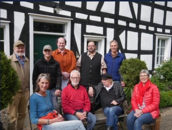
Die WiWa-Gründungsmitglieder 2018 vor Haus Schladern