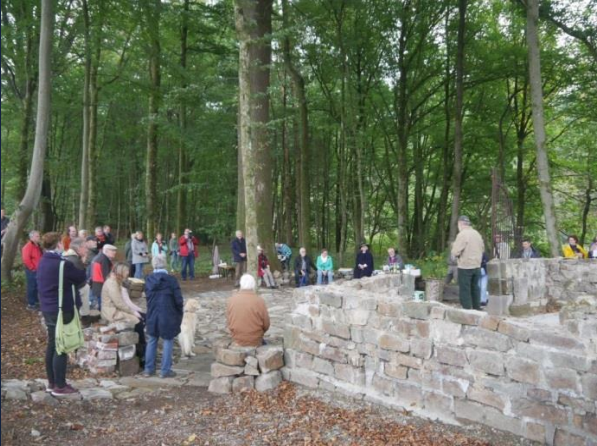
Feierstunde an der freigelegten Ruine des Mausoleums in Schöneck im Herbst 2020

herangetragen werden, ein Beispiel dafür ist die Sicherung des Mausoleums in Schöneck.